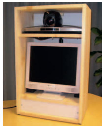
... och i sin väska